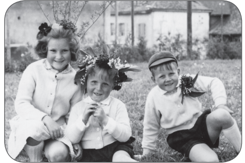
Fête de mai avec ses frères