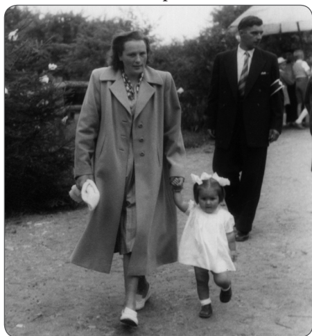
Première Abbaye avec sa maman et son papa.

se retrouver au milieu de sa classe dont les élèves étaient motivés par leur maître M. Rosset: de merveilleux souvenirs. A la grande salle du lieu, une mélodie de Schubert jaillit comme un trait lumineux. Quel trac! Mais surtout quelle plénitude de chanter en solo un air d'Erlkönig: ce roi des aulnes, l'histoire d'un personnage qui se promène à cheval en forêt. Une chanson dramatique vécue avec intensité par une jeune fille qui a perdu sa maman à l'âge de 11 ans. Cette douloureuse séparation donne à la mort une dimension toute particulière, cette mélodie torturée prend tout son sens.