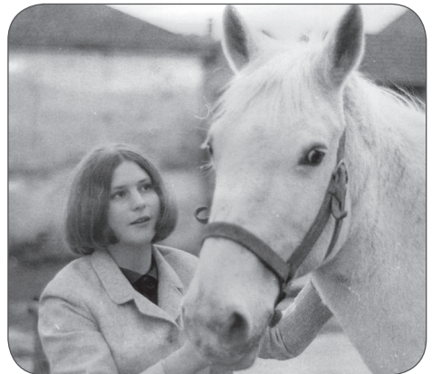
Elle vit de chant et de nature!

Puis au collège d'Echallens, le bonheur de