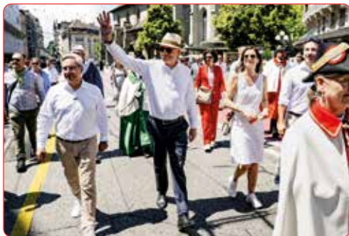
Le conseiller fédéral, Martin Pfister, saluant le public

dont de nombreuses personnalités politiques, l'étendard de notre société s'est élevé avec fierté, montrant au public venu en masse assister au défilé la vigueur de la SCCV et de l'ensemble des associations de notre canton.