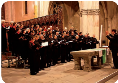
A la tête du chœur Ardito

Il a également conduit le chœur mixte de La Batelière de Buchillon et l'Ensemble