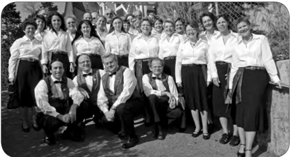
La Vigneronne en costume.

La Récréation donnera son spectacle le 14 mars 2015 au Théâtre de Beausobre à Morges et le prochain concert de La Vigneronne aura lieu à La Maison des Pressoirs à Lonay les 25 et 26 avril 2015 .