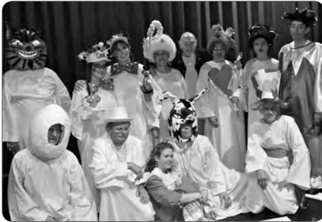
Lors d'un spectacle du 50 ème anniversaire : Alice au Pays des Merveille

Mais voilà une belle page s'est tournée... 51 ans plus tard, La Vigneronne va présenter une autre facette de ses possibilités afin de maintenir en vie une chorale qui en veut.