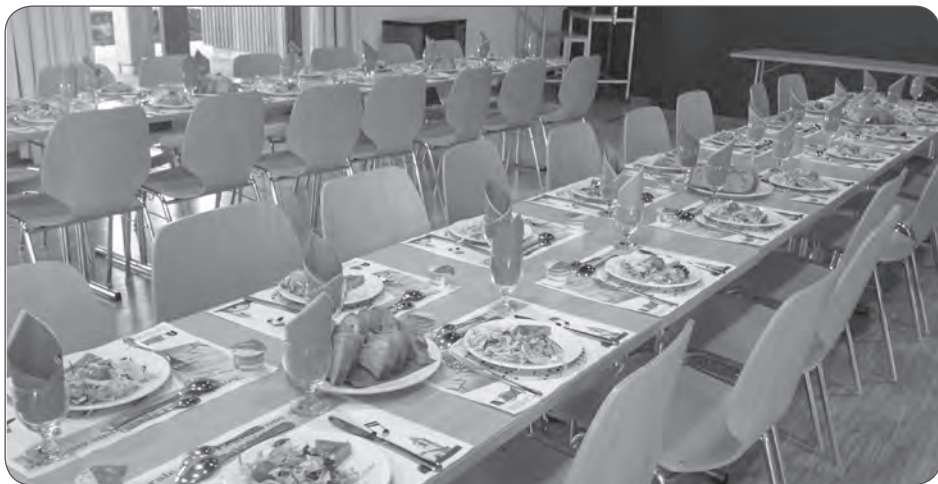
Les participants se sont régalés grâce à l'excellent repas concocté par la chorale de St-Légier

Malgorzata Digaud nous a impressionné par son efficacité et sa pédagogie. Nous avons particulièrement apprécié découvrir le choix des pièces qu'elle nous a proposé. Une ambiance détendue mais travailleuse nous a permis de profiter de chaque minute musicale offerte.