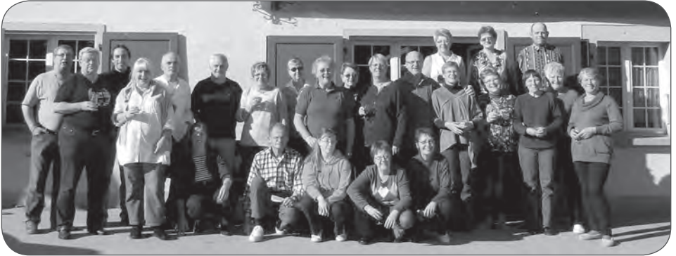
Weekend de répétition aux Cluds (Bullet)

Toute société de chant vivant dans la fraternelle union des chanteurs vaudois, espère un jour fêter un anniversaire ou un jubilé.